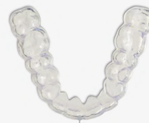
49 min 8 Schienen