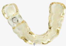
48 min 8 Bohrschablonen

Bislang unerreichte Druckgeschwindigkeiten. Drucken Sie alle 49 Sekunden ein Modell.