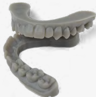
9 min 11 Aligner-Modelle